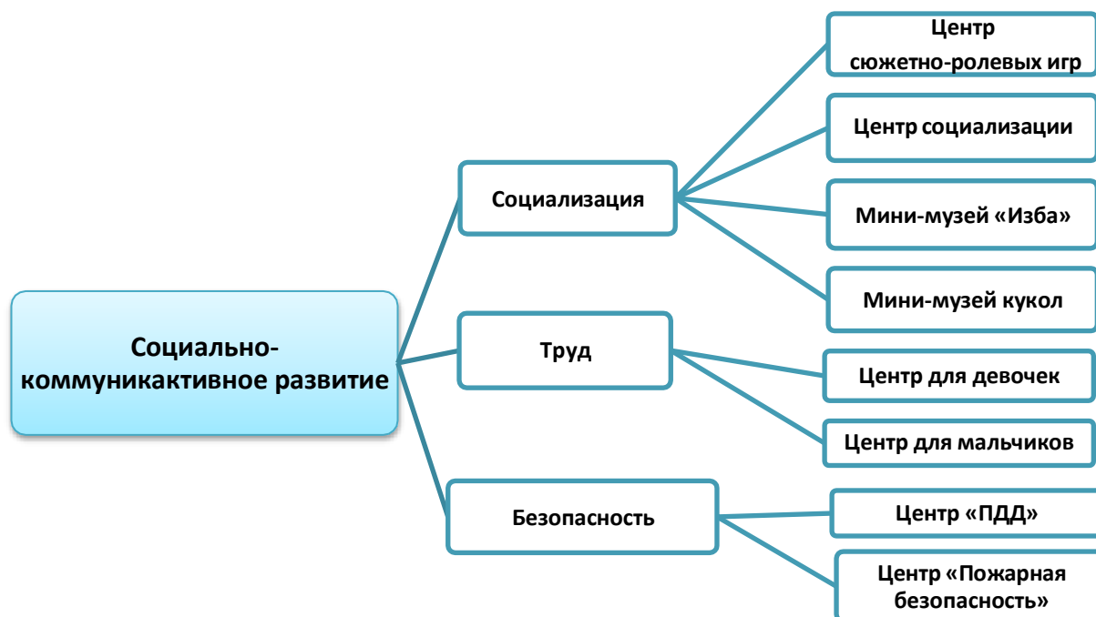
Рисунок 1. Структурная модель предметно-пространственной среды МБ ДОУ №17

Центры детской активности обеспечивают все виды детской деятельности, в которых организуется образовательная деятельность.