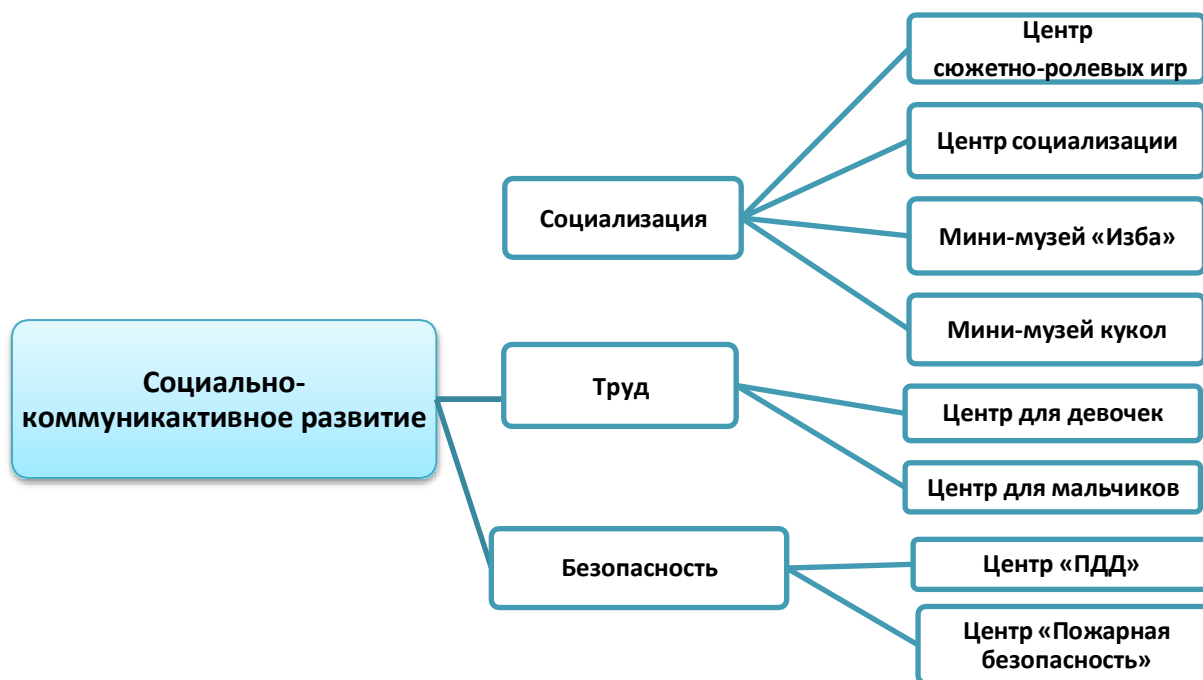
Рисунок 2. Структурная модель предметно-пространственной среды группы.

Центры детской активности обеспечивают все виды детской деятельности, в которых организуется образовательная деятельность.